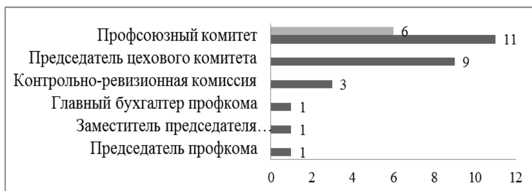
Рис 1. Распределение работников ППО ЗАО «КЗПВ» по виду профсоюзного поручения

Целью деятельности ППО ЗАО «КЗПВ» является представительство и защита индивидуальных социально-трудовых, профессиональных и экономических прав и интересов членов профсоюза, а также коллективных прав и интересов трудового коллектива ЗАО «КЗПВ», вне зависимости от членства в профсоюзе. Численность персонала ППО ЗАО «КЗПВ» на 31.12.2017 г. составляет 19 человек, членами профкома является 6 председателей цеховых профсоюзных комитетов (см. рис. 1).