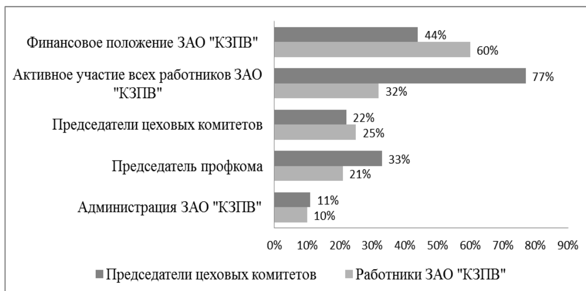
Рис. 4. Факторы, влияющие на деятельность профсоюзной организации

обязанностях его членов в соответствии с Уставом ГМПР и ведет к падению авторитета профсоюзного актива, к снижению значимости роли профсоюзной организации в системе управления стимулированием труда для большинства работников ЗАО «КЗПВ» (см. рис 4).