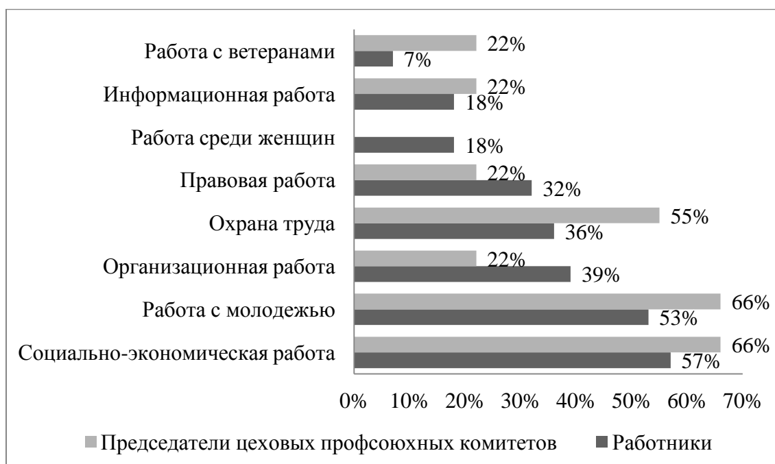
Рис. 3. Направления деятельности профсоюзной организации ЗАО «КЗПВ», нуждающиеся в совершенствовании

От профсоюзной организации большая часть персонала ЗАО «КЗПВ» (64% опрошенных) в первую очередь ждет действий в области повышения заработной платы. Значимость работы в области охраны труда и проведении досуговых мероприятий для респондентов оказалась равной, 36% работников предприятия поставили эти направления деятельности на второе место. При этом участники опроса отметили направления деятельности профсоюзной организации в системе стимулирования труда персонала, нуждающиеся в совершенствовании: это охрана труда, работа с молодежью и социально-экономическая работа (см. рис. 3).