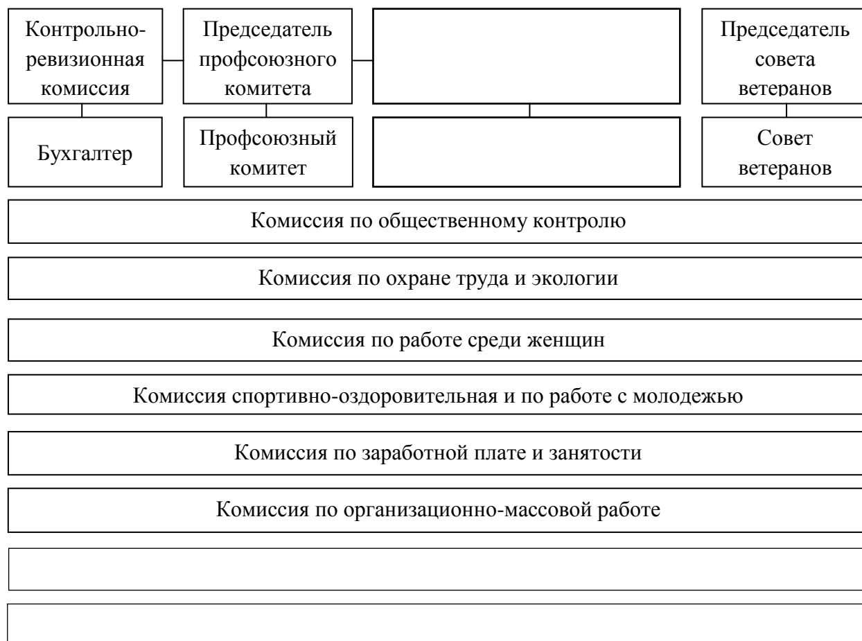
Рис. 2. Производственная структура ППО ЗАО «КЗПВ»

деятельности ППО ЗАО «КЗПВ». Труд главного бухгалтера ППО ЗАО «КЗПВ» регулируется в общем порядке, предусмотренном ТК РФ. Производственная структура ППО ЗАО «КЗПВ» представлена на рис.2.